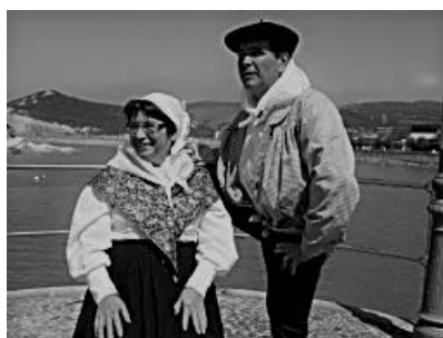
Madalentxu eta Antolintxu

En la actualidad, tras el txupinazo que da comienzo a los festejos, sigue manteniéndose la costumbre del paseo hasta la ermita de Andra Mari, pero en lugar de la imagen del santo, es el personaje denominado Antolintxu quien preside la procesión.