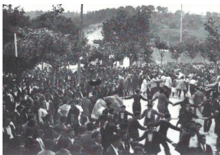
Romería en el Astillero, año 1907

Con el fin de animar la fiesta, se había instalado cerca de allí un ventero gorliztarra que, para furia de los taberneros de la villa, vendía el vino más barato que en las tascas de Plentzia.