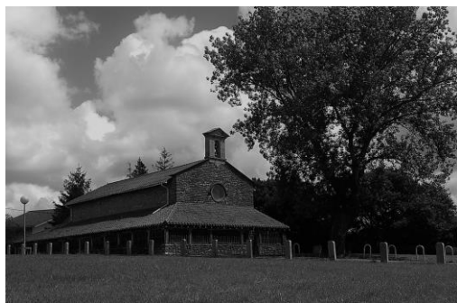
Agirreko Andra Maria ermita

Ohitura ezaguna da Plentzian, San Antolinen izenean ospatzen diren herriko jaien hasieran Agirreko Andra Maria ermita bisitatzen dela. Plentziako herrigunetik hurbil, baina lurrez Gorlizko elizatean dago ermita hori.